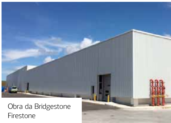
Obra da Bridgestone Firestone

Em Lavras, os desafios proporcionados durante a ampliação da oficina de locomotivas também foram moti-