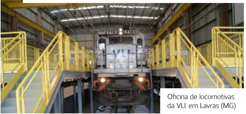
Oficina de locomotivas da VLI, em Lavras (MG)